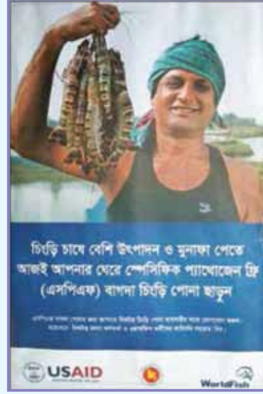
এসপিএফ চিংড়ি চাষ বিষয়ক প্রচারণা

চিংড়ি সেক্টর বাংলাদেশে বৈদেশিক মুদ্রা অর্জনের ক্ষেত্রে গুরুত্বপূর্ণ ভূমিকা পালন করছে। উপকূলীয় এলাকার ১০ লক্ষের বেশি লোকের জীবন-জীবিকা বাগদা চিংড়ি চাষের ওপর নির্ভরশীল। বৃহত্তর খুলনা এবং কক্সবাজার এলাকায় প্রায় ১.৭৫ লক্ষ হেক্টর উপকূলীয় জমিতে চিংড়ি চাষ হচ্ছে। বর্তমানে বাংলাদেশে ৫৫ টির বেশি বাগদা চিংড়ি হ্যাচারি রয়েছে। বাগদা চিংড়ি হ্যাচারি গুলোতে বঙ্গোপসাগর হতে আহরিত প্রাকৃতিক চিংড়ি ব্রুড ব্যবহার করা হয়। এসব বাগদা চিংড়ি হ্যাচারি বছরে ১০০০ কোটির বেশি বাগদা চিংড়ির পিএল উৎপাদন করে চিংড়ি খামারগুলোতে সরবরাহ করে।