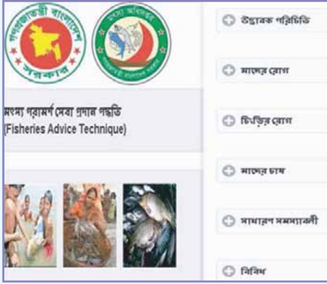
মৎস্য পরামর্শ সেবা প্রদান পদ্ধতি নামক মোবাইল অ্যাপসটির পরিচায়ক অংশ

নোয়াখালী সদর উপজেলার মৎস্যচাষিগণ সঠিক তথ্য না জানা ও যোগাযোগ সমস্যার কারণে মৎস্যচাষ, মাছের রোগ বালাই ও অন্যান্য সমস্যা সংক্রান্ত পরামর্শ সেবা থেকে বঞ্চিত হতেন-