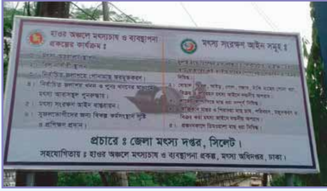
মৎস্য সংরক্ষণ আইন বাস্তবায়নে সিলেট বিভাগ কর্তৃক স্থাপিত বিলবোর্ড