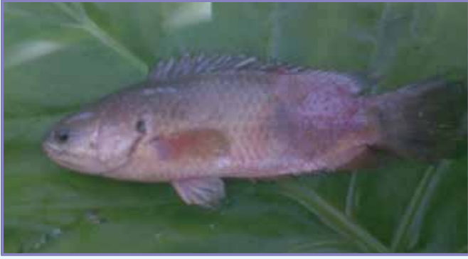
রোগাক্রান্ত ভিয়েতনামি কৈ মাছ