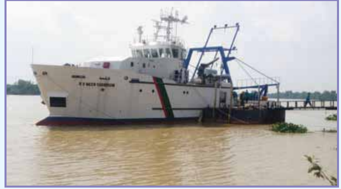
গবেষণা ও জরিপ জাহাজ আর ভি মীন সন্ধানী

বঙ্গোপসাগরে বাংলাদেশের একান্ত অর্থনৈতিক এলাকায় (EEZ) মাছের সৃষ্টি প্রজনন ও সামুদ্রিক মৎস্য সম্পদ সংরক্ষণের জন্য এস.আর.ও.নং ৯৭-আইন/২০১৫, তাং- ১৭/০৫/২০১৫ খ্রি. মূলে সরকার কর্তৃক Marine Fisheries Rules, ১৯৮৩ এর সংশোধনের মাধ্যমে প্রতি বছর ২০ মে হতে ২৩ জুলাই পর্যন্ত মোট ৬৫ (পঁয়ষট্টি) দিন বঙ্গোপসাগরে বাণিজ্যিক ট্রলার দ্বারা সকল প্রকার মৎস্য ও ক্রাস্টাসিয়ান আহরণ নিষিদ্ধ করে প্রজ্ঞাপন জারী করা হয়। গত বছরের ন্যায় এবছরও ২০ মে হতে ২৩ জুলাই পর্যন্ত মোট ৬৫ (পঁয়ষট্টি) দিন বঙ্গোপসাগরে সকল প্রকার বাণিজ্যিক ট্রলার দ্বারা মৎস্য ও ক্রাস্টাসিয়ান আহরণ বন্ধ থাকবে।