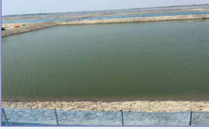
একটি আবদ্ধ পদ্ধতির বাগদা চিংড়ির খামার