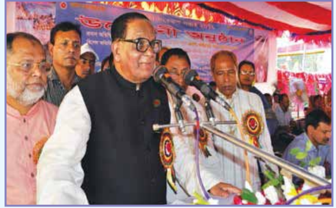
জাটকা সংরক্ষণ সপ্তাহ ২০১৬ এর উদ্বোধনী ঘোষণা করছেন মাননীয় মন্ত্রী, মৎস্য ও প্রাণিসম্পদ মন্ত্রণালয়

উদ্বোধনী সমাবেশে মাননীয় মন্ত্রী প্রায় ৭ হাজার জেলে, মৎস্যজীবী, মৎস্য ব্যবসায়ীসহ উপস্থিত সংশ্লিষ্টদের উদ্যেশ্যে বক্তব্য প্রদান করেন। তিনি উল্লেখ করেন যে, মাননীয় প্রধানমন্ত্রী জননেত্রী শেখ হাসিনার নেতৃত্বাধীন সরকার ইলিশ সম্পদ রক্ষা এবং এর উন্নয়নে বিভিন্ন সমায়োগ্যোগী এবং বাস্তবমুখী কর্মপরিকল্পনা গ্রহণ ও বাস্তবায়ন করেছে। এসব কার্যক্রম বাস্তবায়নের ফলে বিগত ২০১৪-১৫ অর্থ বছরে ইলিশের উৎপাদন বৃদ্ধি পেয়ে ৩.৮৭ লক্ষ মে. টনে উন্নীত হয়েছে।