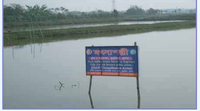
চিংড়ি চাষে বড়ডাঙ্গা মডেল, ডুমুরিয়া, খুলনা

২০১৪ সালের কার্যক্রম শেষে উৎপাদন হয়েছে প্রায় দ্বিগুণ। বর্তমানে গড়ে হেক্টর প্রতি উৎপাদন গলদা ৮১০ কেজি, বাগদা ৫১০ কেজি এবং কার্পজাতীয় মাছ ৯০০ কেজি। ২০১৫ সালের শেষে এ উৎপাদন বেড়ে দাঁড়িয়েছে গলদা ৯৬০ কেজি, বাগদা ৫২৩ কেজি এবং কার্প জাতীয় মাছ ৮৭৬ কেজি। শুধু উৎপাদন বৃদ্ধিই নয়, নিরাপদ ও স্বাস্থ্যসম্মত মাছ ও চিংড়ি উৎপাদনে বড়ডাঙ্গা গ্রামের ক্লাস্টার চাষিরা বিশেষ ভূমিকা রাখছে। মৎস্য অধিদপ্তর এ কার্যক্রমের সম্প্রসারণ ঘটানোর লক্ষ্যে একে ‘বড়ডাঙ্গা চিংড়ি চাষের মডেল’ হিসেবে ঘোষণা করেছে।