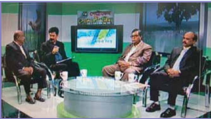
এটিএন বাংলায় হাওর অঞ্চলে মৎস্যসম্পদের সত্তাবনা বিষয়ক টক শো মার্চ ২০১৬ প্রচারিত হয়

মাছের রোগ নিরাময়ে সবসময় নিকটস্থ মৎস্য দপ্তরের পরামর্শ ও চিকিৎসা সেবা গ্রহণ করুন।