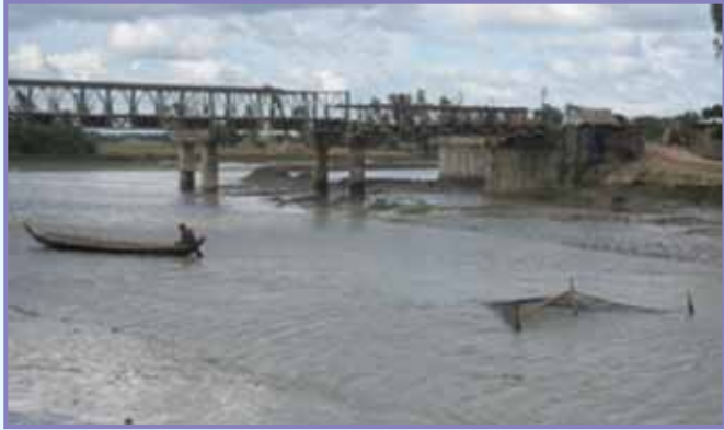
উপকূলীয় নদীতে স্থাপিত অবৈধ বেহুন্দী জাল

মাননীয় প্রধানমন্ত্রী শেখ হাসিনার নেতৃত্বাধীন সরকার ইলিশ সম্পদ রক্ষা ও উন্নয়নে দৃঢ় প্রতিজ্ঞ। জাটকা ও মা ইলিশ রক্ষায় সরকারি সহায়তা যেমন রয়েছে তেমনই অবৈধ জালের ব্যবহার রোধ করতে আইন বাস্তবায়ন জোরদার করা হয়েছে। এ বছরই প্রথমবারের মতো জাটকা রক্ষা অভিযানের পাশাপাশি অবৈধ জাল নির্মূলে অভিযান পরিচালনা করা হয়েছে।