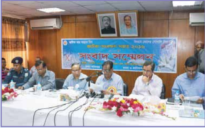
জাটকা সংরক্ষণ সপ্তাহ ২০১৬ উপলক্ষে মৎস্য ভবন, ঢাকায় আয়োজিত সংবাদ সম্মেলন

বিগত ০২ মার্চ হতে ০৮ মার্চ পর্যন্ত দেশের জাটকা সমৃদ্ধ উপকূলীয় ২৮ টি জেলায় একযোগে জাটকা সংরক্ষণ সপ্তাহ উদ্বোধন করা হয়েছে। এ উপলক্ষে মৎস্য অধিদপ্তর এবং মৎস্য ও প্রাণিসম্পদ মন্ত্রণালয় কেন্দ্রীয় ও মাঠ পর্যায়ে বিভিন্ন কর্মসূচি বাস্তবায়ন করেছে। সপ্তাহের ১ম দিন অর্থাৎ ২ মার্চ সকাল ৮:০০ টায় মৎস্য ও প্রাণিসম্পদ মন্ত্রণালয়ের মাননীয় মন্ত্রী জনাব মোহাম্মদ ছায়েদুল হক এমপি- এর নেতৃত্বে মৎস্য ও প্রাণিসম্পদ মন্ত্রণালয় এবং মৎস্য অধিদপ্তরসহ বিভিন্ন দপ্তর, সংস্থা ও প্রতিষ্ঠানের কর্মকর্তা/কর্মচারী, মৎস্যচাষি,